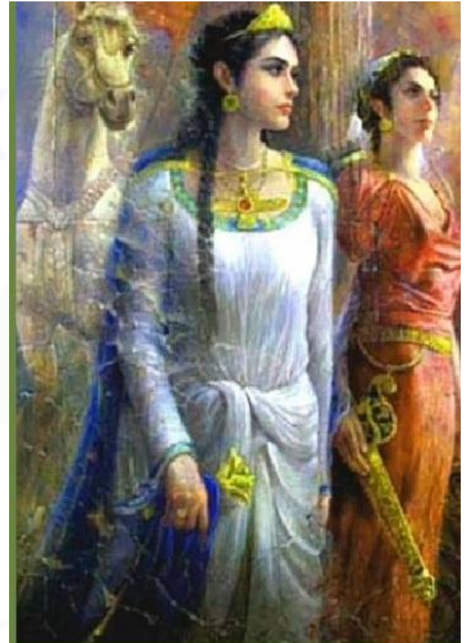
Vashti Queen of the Ancient Medes-Part I