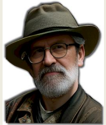
Por Eliyahu BaYona

“Y Dios le dijo a Israel en una visión de la noche, y dijo: ‘Yaakov, Yaakov’”.