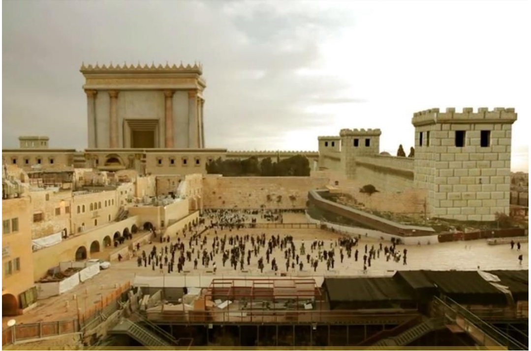
Salomón y El Templo