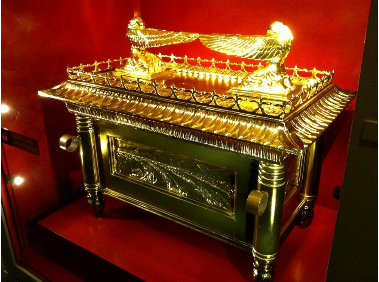
PARASHA SHEMOT TERUMA