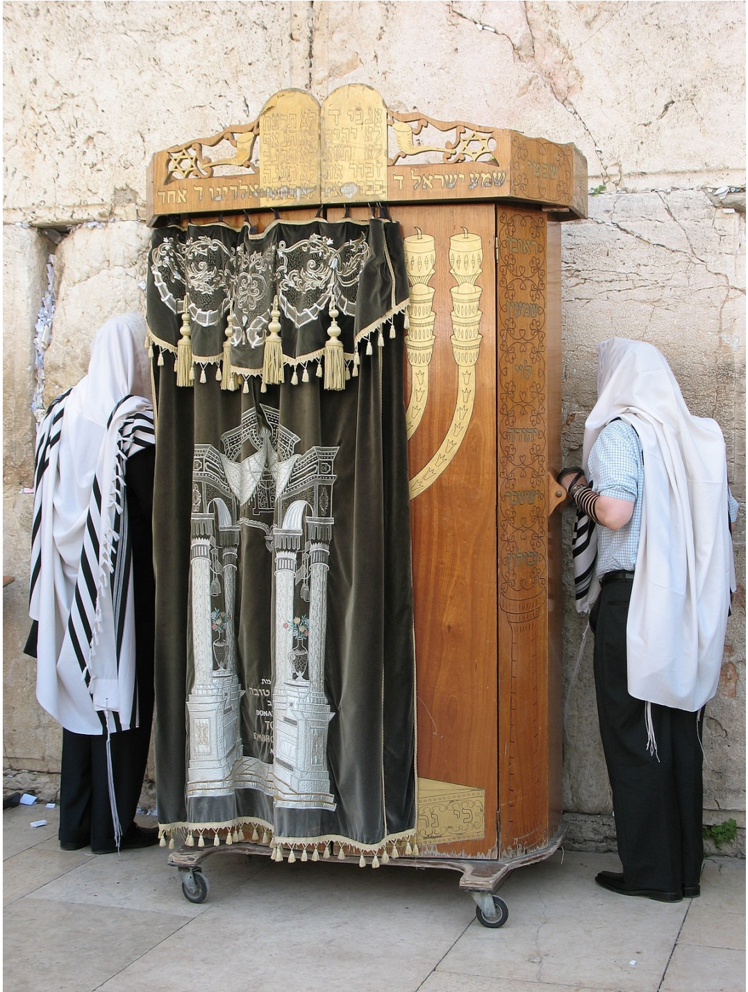
PARASHA SHEMOT TERUMA