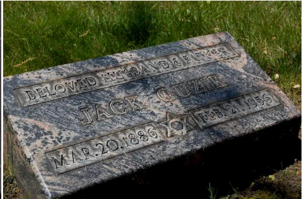
Jake "Greasy Thumb" Guzik