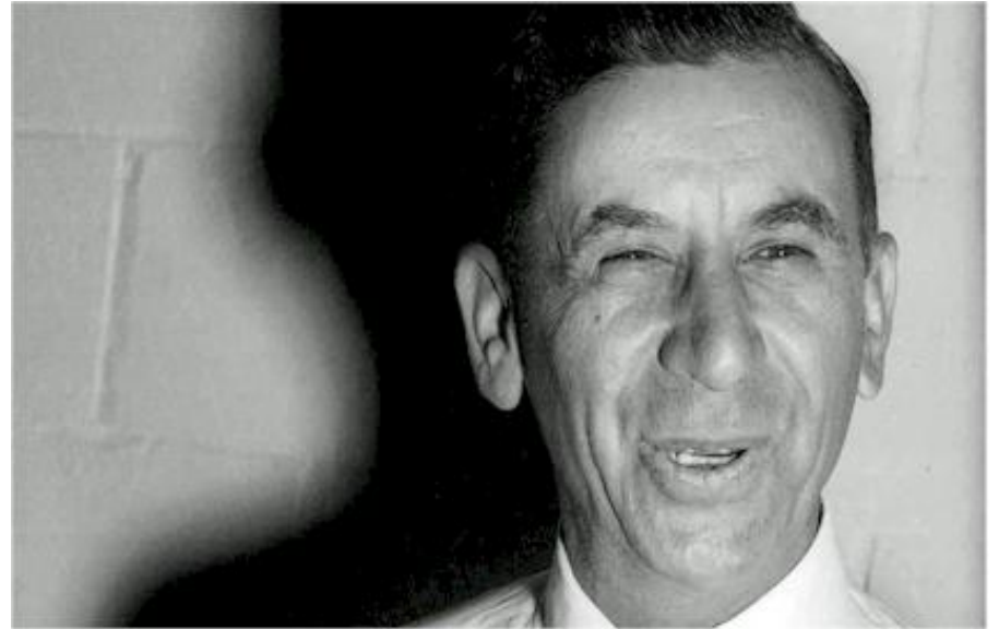
Binyamin 'Bugsy' Siegel y Meyer Lansky